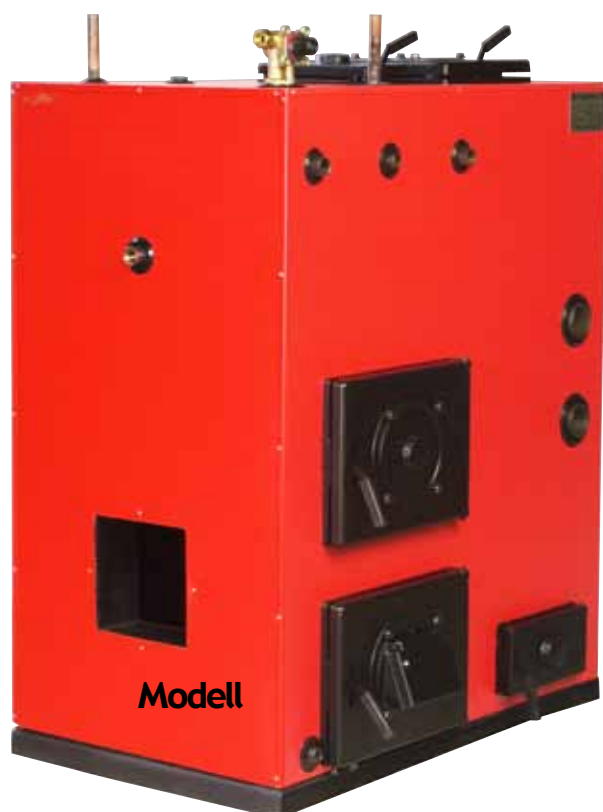
F 60 Flismatning gavel