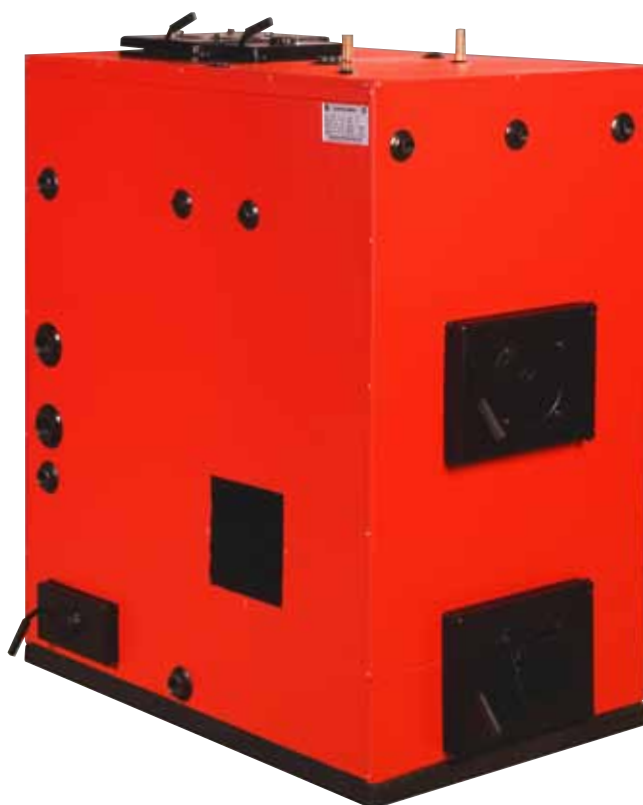
F 60 Flismatning vänster

Bilden visar pannan i standardutförande. Anslutningar kan placeras efter kundens önskemål vid beställning.